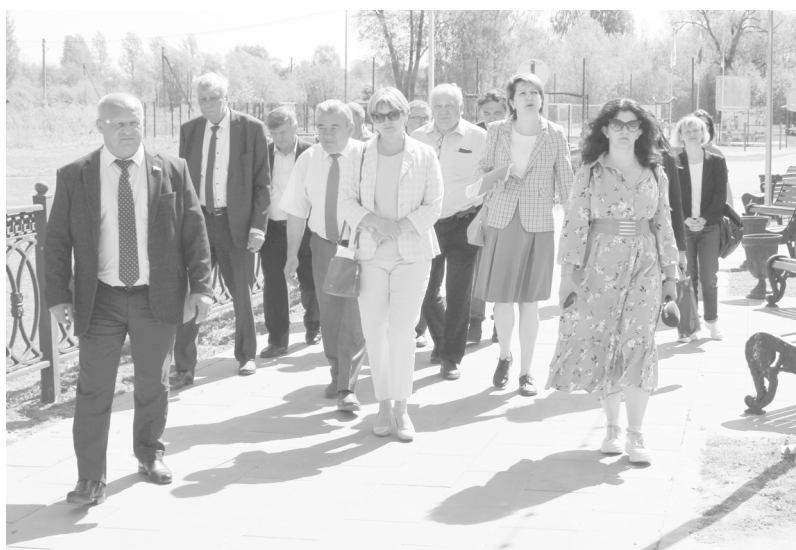
Выездной комитет Думы на набережной р.Юхоть в Большом Селе