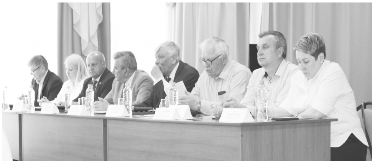
Заседание выездного комитета областной Думы в районном Доме культуры